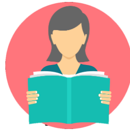
Bajo nivel educativo