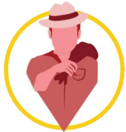
El Abandono del Campo