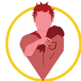
Altos Niveles Pobreza